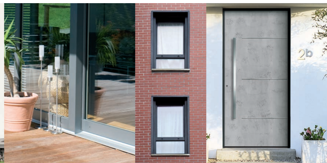
Système AluClip sur les portes d'entrée

Alors Alu ou PVC ? AluClip est la solution pour bénéficier des atouts des 2 matériaux et apporter à votre habitat l'esthétique et les performances optimales pour y vivre confortablement en économisant l'énergie !