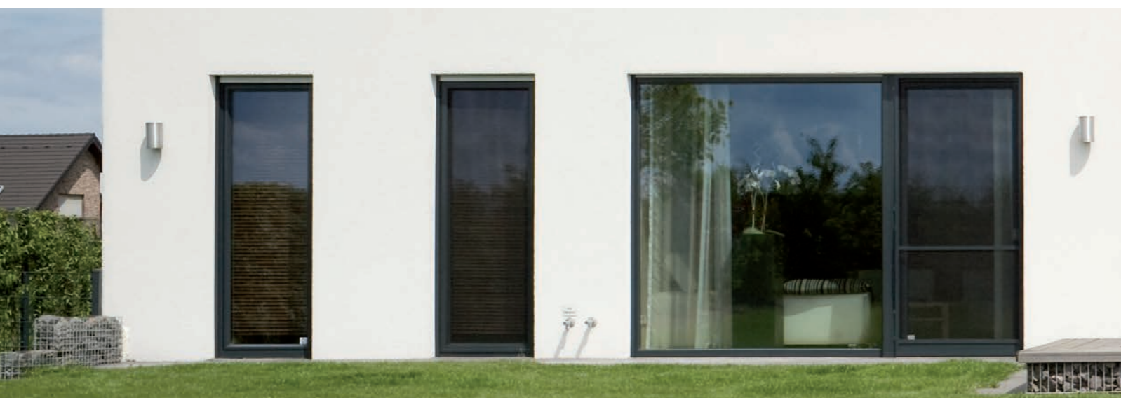
Système AluClip avec capotage aluminium extérieur de couleur RAL 7016

Les performances thermiques des fenêtres AluClip sont aussi performantes que des fenêtres PVC renforcées. Ces fenêtres mixtes fabriquées sans contraintes supplémentaires vous permettront de laisser libre cours à votre imagination pour rendre votre maison unique !